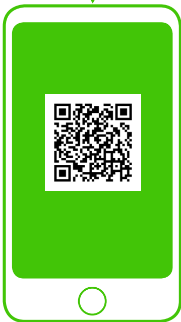
※新型コロナウイルス対策パーソナルサポート（行政） QRコードから登録